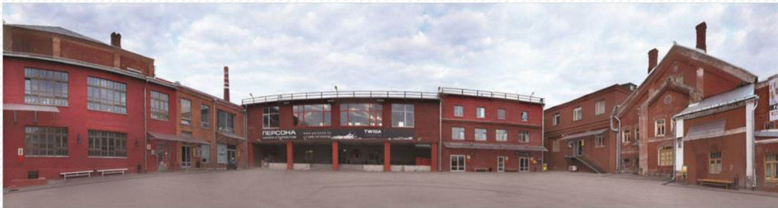
Центр современного искусства «Винзавод», бывший завод шампанских вин