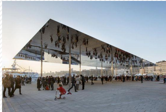
Реновация старого порта Марселя (Франция) как общественного пространства, доступного всем