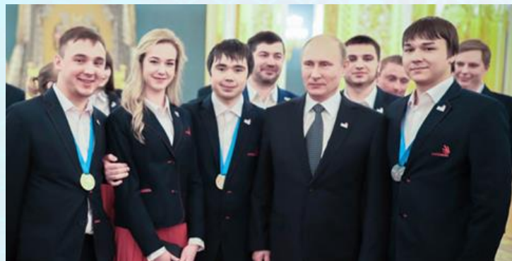
Декабрь 2016 года ВСТРЕЧА С ПРЕЗИДЕНТОМ РФ СТУДЕНТОВ КТИТС – ПРИЗЕРОВ WSI