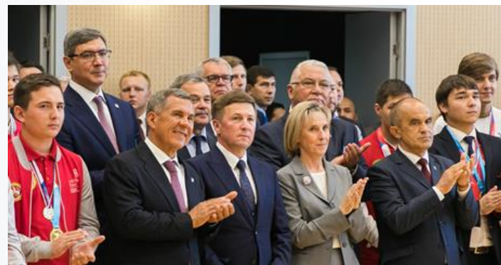
1 сентября 2017 года ЗАПУСК МЦК