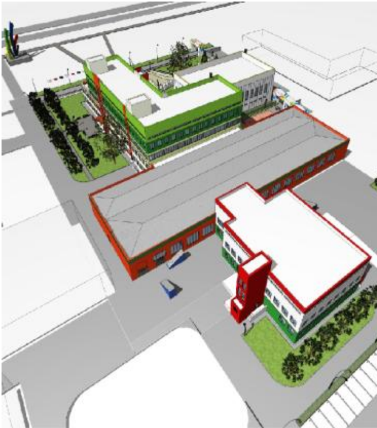
СИМБИРСКПРОЕКТ 2016 г.

Разработан эскизный проект «Капитальный ремонт здания авиационного колледжа с размещением межрегионального центра компетенций в области обслуживания транспорта и логистики», а так же расчет стоимости ремонтных работ здания и инженерных систем.